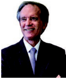
Julien Jensen hat ein Konzept entwickelt, dass auf der „New Normal“ These von Bill Gross (Bild) basiert

Die noch junge Gesellschaft KJL Capital will dem mit dem KJL Capital Absolute Return UI Anlegern eine Lösung für die aktuellen Probleme wie Niedrigzins, Liquiditätsschwemme, Staatsschuldenkrise und Volatilitätsschocks bieten